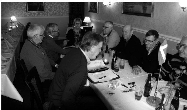
Deltagere i generalforsamlingen