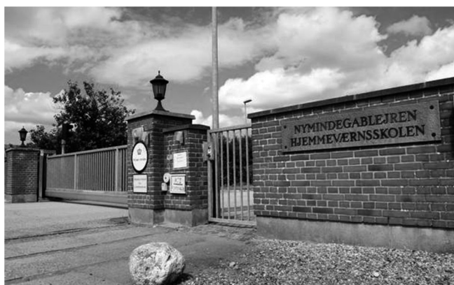
Indgang Nymdegablejren

Efterhånden nåede vi ud mellem klitterne, der så noget øde ud, næsten ingen huse, men en masse marerhalm, endelig kørte vi over vejen og ind gennem en port i pigtråden, og holdt med toget uden for nogle barakker, fra tysker tiden, vi kom ud og blev stillet op, der var vist lidt over 200 mand, vi blev ført i en lang kolonne, ad nogle betonveje ind mellem bjergfyrbekvæmning, barakkerne som vi var stoppet ved var Hjemmeværnsskolen, og vi skulle op i den anden ende af lejren, det var ligesom at der ikke blev råbt