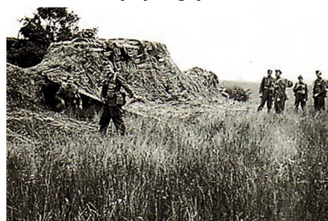
Sløring af lastvogne