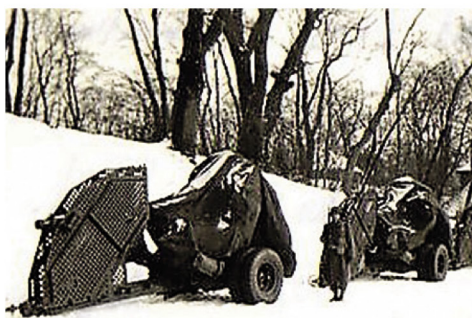
90 mm kanon i transportstilling