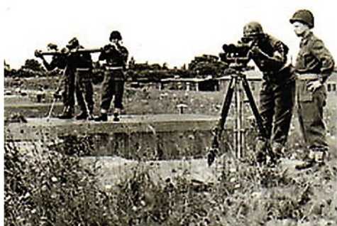
Trædning i observation

Der fortsættes med foto fra dengang vi var indkaldt. Her er foto leveret af Leif Stolzenbach-Olsen årgang 1952 fra Avedøre Lejren, Sjællandske Luftværnsregiment.