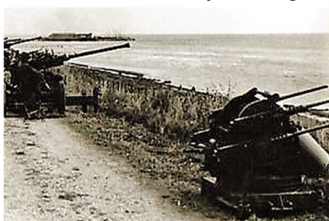
Skydning med 40 mm kanon