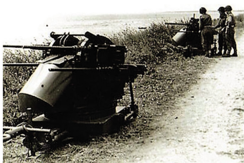
Skydning med Firling