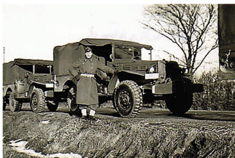
Køretøjer klar med kører