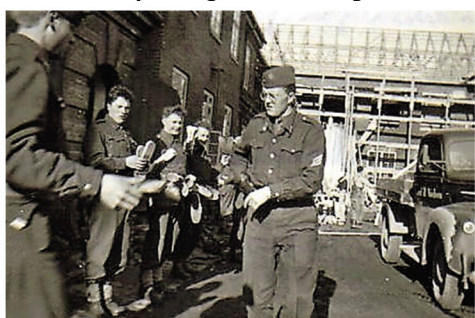
Kontrol af udrustning