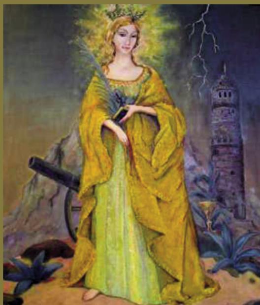
Sct. Barbara – Luftværnsartilleriets skytshelgen – Hænger i dag i messen i Oksbøllejren.

Med venlig LAF-hilsen Bestyrelsen i 100-Mandsforeningen.