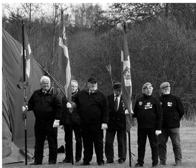
De deltagende soldaterforeninger med LAF-fanen i midten